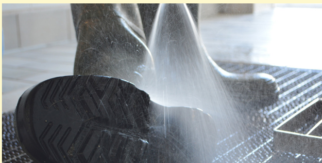
Reinigung und Desinfektion der Stiefel vor und nach dem Betreten des Stalls