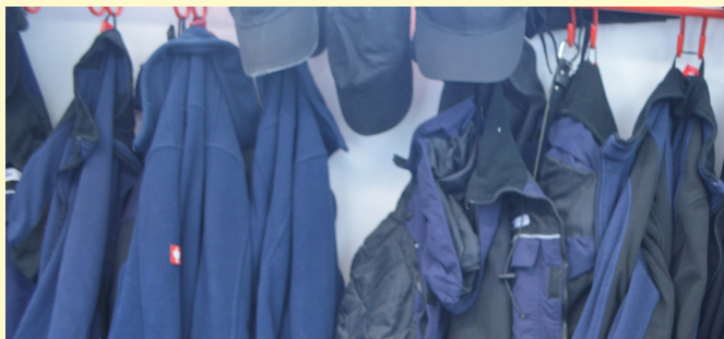
Betreten der Ställe ausschließlich in Stallbekleidung